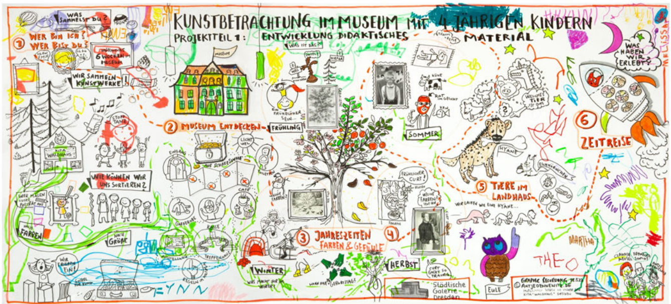
Illustration ©Antje Dennewitz